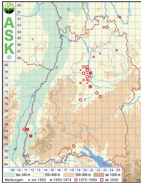
3. Cantharis annularis MÉNÉTRIES, 1836 ( C. oculata GEBLER, 1827)